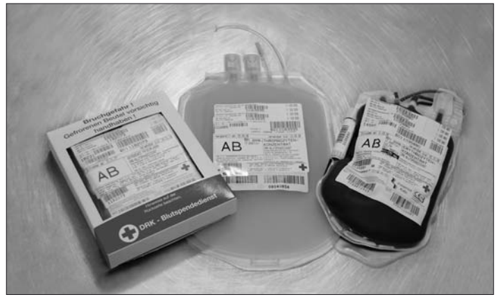
vlnr. Blutplasma, Blutplättchen und rote Blutkörperchen

Rote Blutkörperchen sind bei 4°C gekühlt maximal fünf Wochen haltbar. Sie werden vor allem bei Operationen, Blutarmut und bei Organtransplantationen benötigt. Blutplättchen müssen unter ständiger Bewegung bei Raumtemperatur gelagert werden und sind nur fünf Tage lagerfähig. Sie sind z.B. lebens-