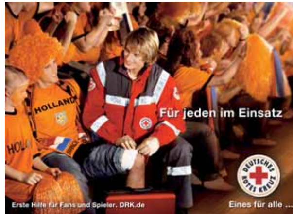
Dekoplatkat für die zweite Phase ab Januar 2006.