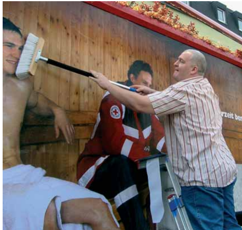
Köln, 14.5.2005: Comedian Markus Maria Profitlich kam beim Anbringen des Sauna-Motivs selbst ins Schwitzen und sorgte als prominenter Plakatkleber für reichlich Aufsehen.

der neuen Imagekampagne eine hohe Durchdringung erreichen. Auf diesem soliden Fundament geht es nun in die Phase zwei mit dem Motiv „Stadion“ unter dem Motto „Für jeden im Einsatz“. Und erneut sind alle Landes- und Kreisverbände aufgerufen, die Botschaft dieser neuen Phase mit Presse-Plakatklebterminen bekannt zu machen. Eine Checkliste (auf Seite 8) zur Durchführung der Termine zeigt, wie man dieses Ziel Schritt für Schritt erreicht. Viel Erfolg!