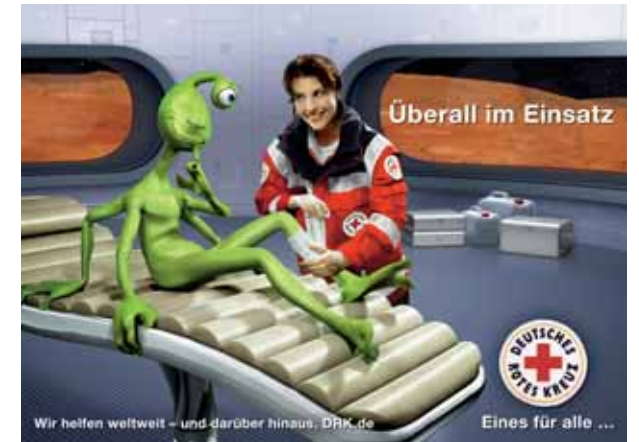
Dekoplatkat für die dritte Phase ab Juli 2006.