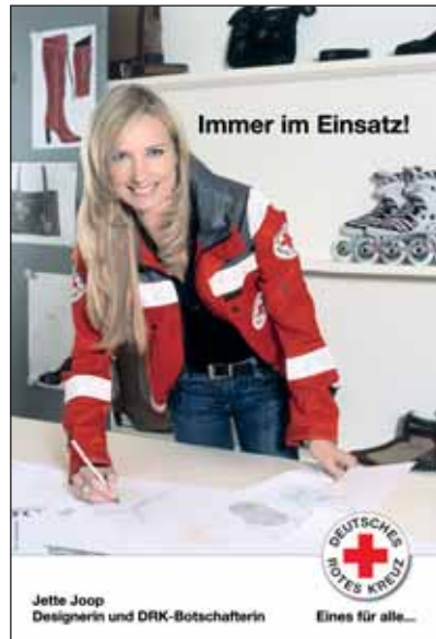
Jette Joop Designerin und DRK-Botschafterin

Um den tatkräftigen Einsatz der Botschafter auch von DRK-Seite werbewirksam zu unterstützen, wurde die Botschafter-Linie ins Leben gerufen. In Anlehnung an die Imagekampagne wird für jeden prominenten Ehrenamtlichen ein Motiv entwickelt, das ihn in seinem jeweiligen originären Arbeitsumfeld zeigt, wie bei-